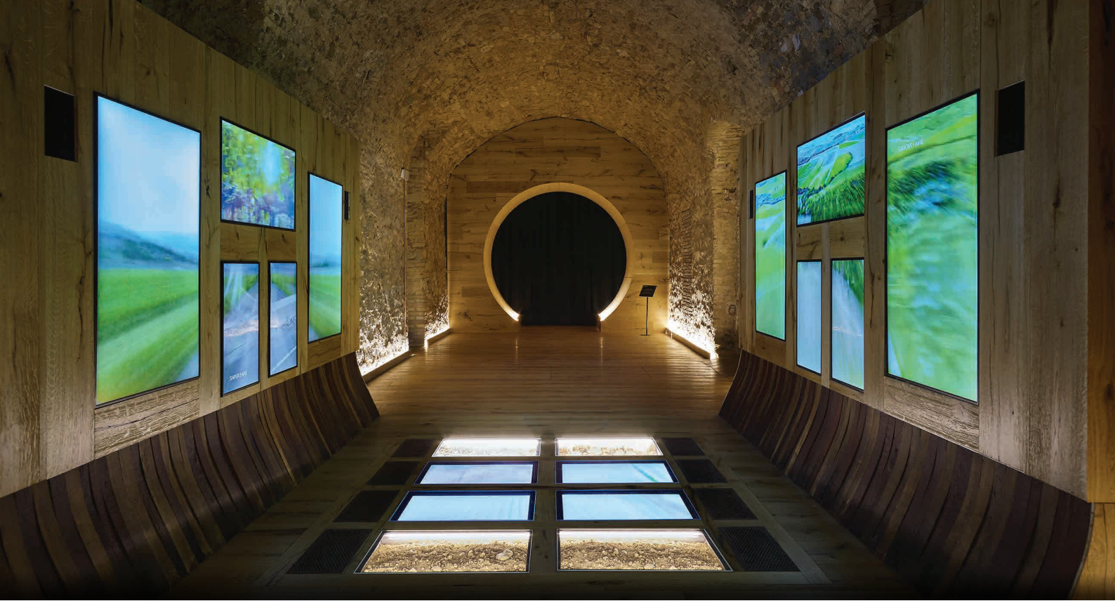
Tempio del Brunello, Montalcino, Siena

At each destination, Opera Laboratori provides booking services and entrance tickets, and also creates cultural events, conferences and exclusive openings in unique and extraordinary places, implementing and personalising proposals with supplemental services in compliance with high quality standards.