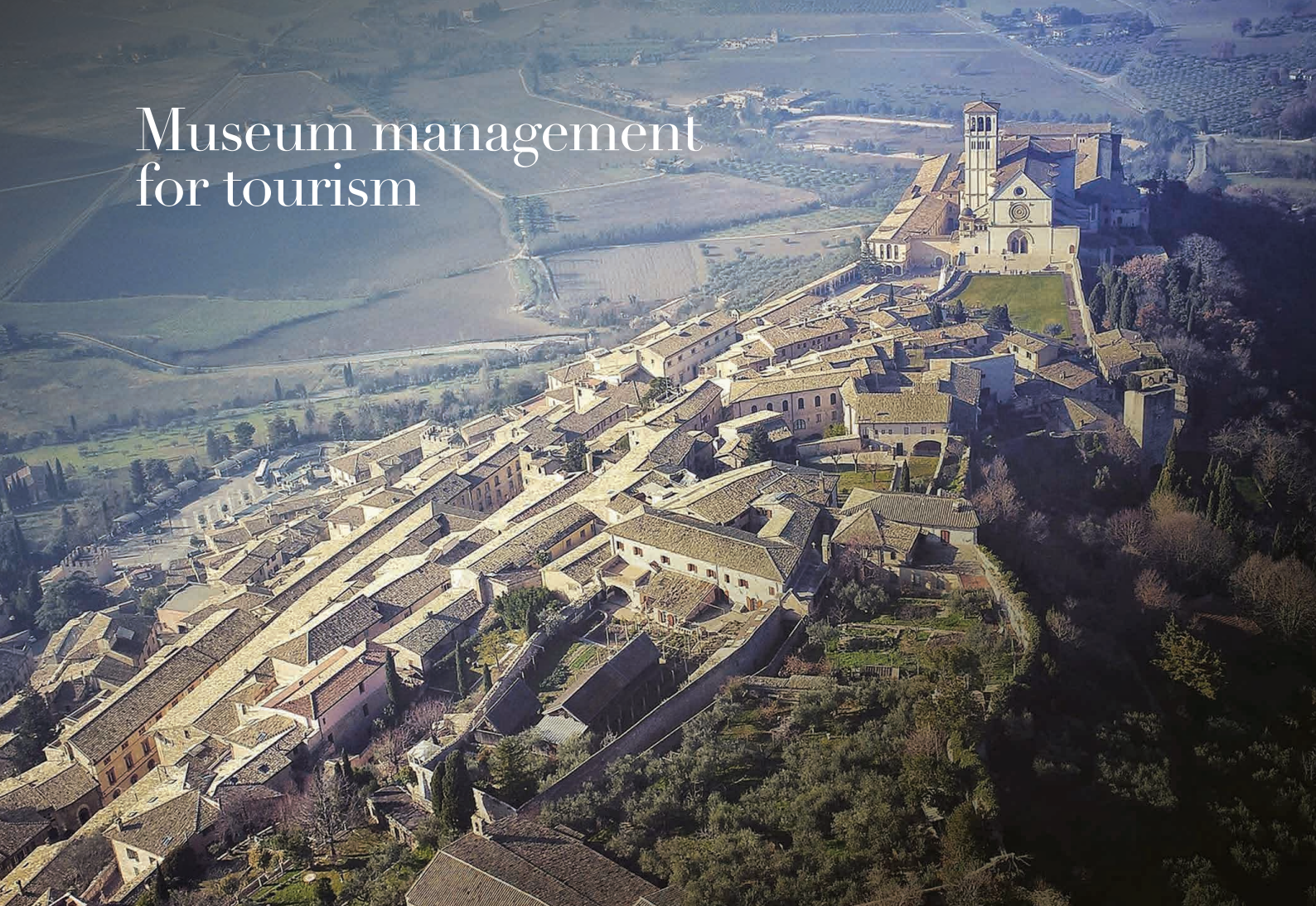
Veduta di Assisi

Da gestore ufficiale dei più noti musei italiani, Opera Laboratori è quindi la via di accesso più sicura e vantaggiosa a mete come Uffizi, Galleria dell'Accademia di Firenze, Parco Archeologico di Pompei, Duomo di Siena, etc.