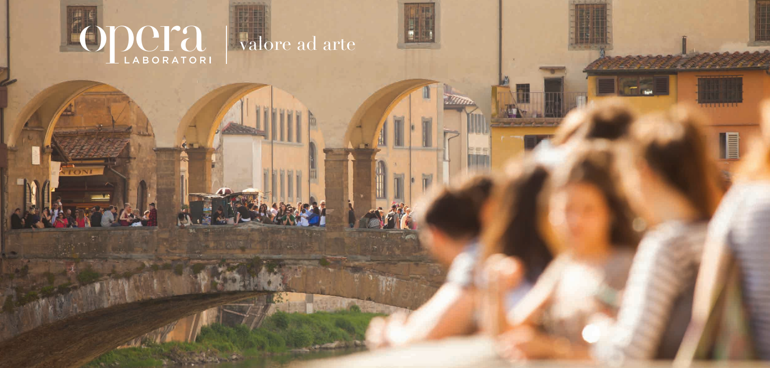
Veduta del Ponte Vecchio, Firenze

Opera Laboratori, leader nazionale nell'ambito della gestione museale, vanta un'esperienza unica, frutto di un'attività ventennale anche nella produzione e realizzazione di mostre, e sicura affidabilità dimostrata dai contratti, rinnovati nel tempo, con prestigiosi enti pubblici e importanti istituti privati ed ecclesiastici.