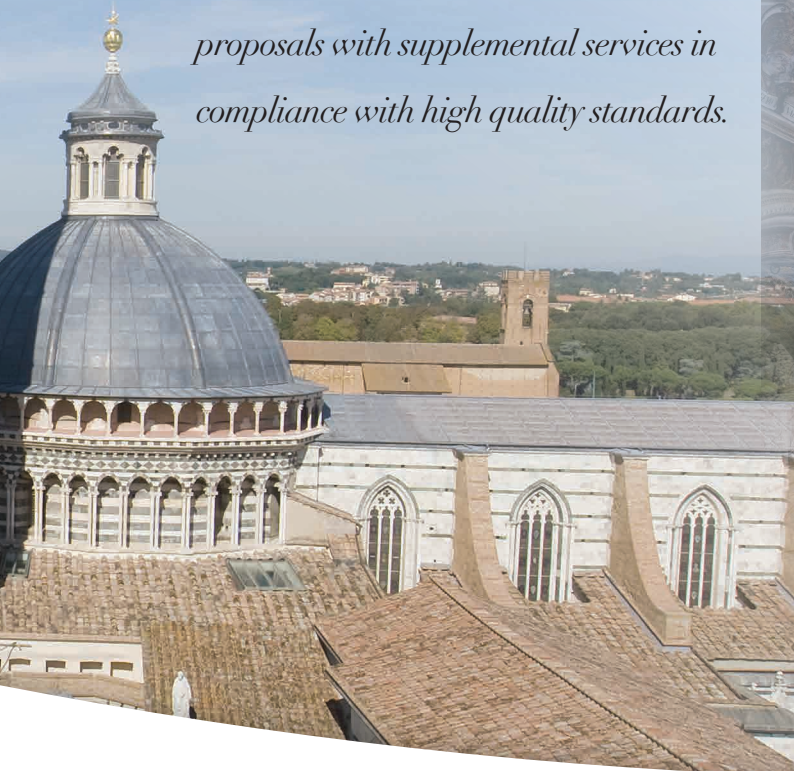
Duomo di Siena, veduta della fiancata laterale esterna e della navata centrale

At each destination, Opera Laboratori provides booking services and entrance tickets, and also creates cultural events, conferences and exclusive openings in unique and extraordinary places, implementing and personalising proposals with supplemental services in compliance with high quality standards.